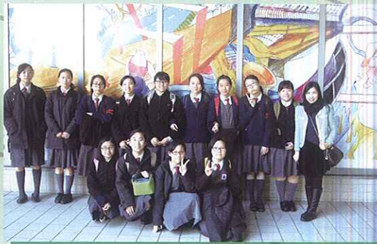
視藝科同學參觀了「全港中學生創作展」