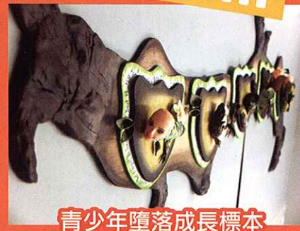
青少年墮落成長標本