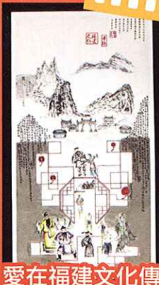
愛在福建文化傳承